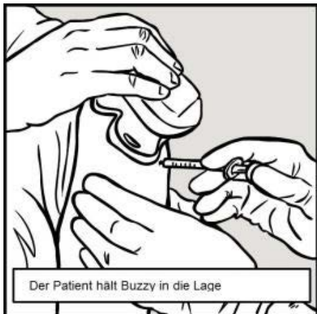
Der Patient hält Buzzy in die Lage