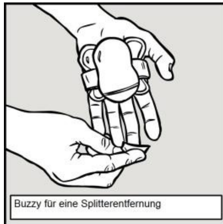
Buzzy für eine Splitterentfernung