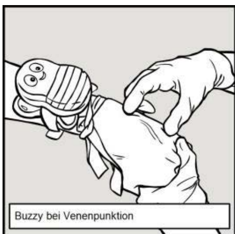
Buzzy bei Venenpunktion