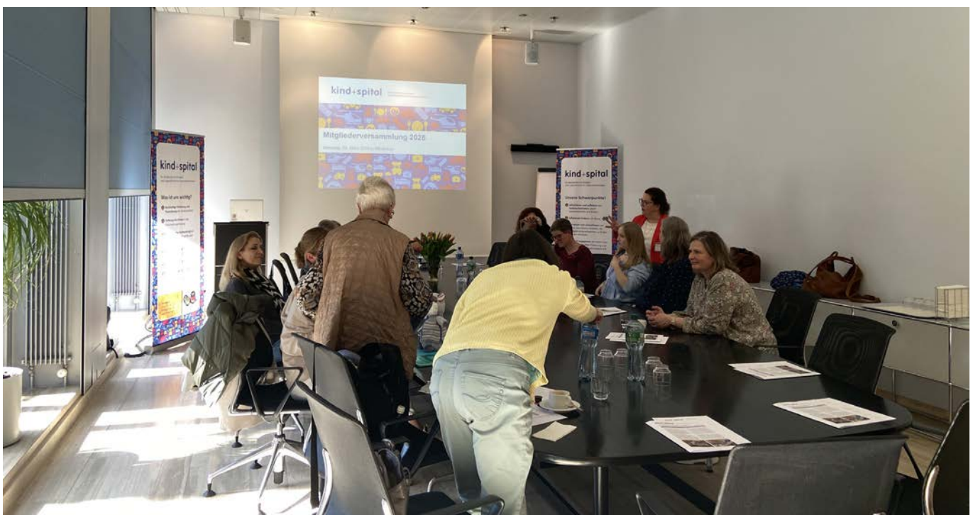
Mitgliederversammlung 2025 im Kantonsspital Winterthur

Zudem nahmen wir an beiden Konferenzen des Netzwerks Kinderrechte Schweiz teil und vertieften unsere Vernetzung.