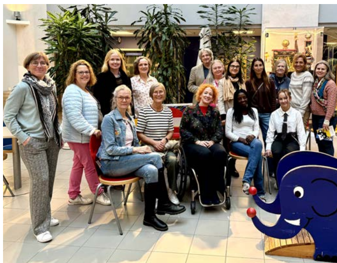
Treffen der europäischen Organisationen an der EACH-Tagung in Lund, SE

Das Projekt Spitalspielkoffer+ ist 2025 nochmals deutlich gewachsen. Nach den erfolgreichen Starts in Zürich und Aargau konnten wir Ende des Jahres auch in der Ostschweiz (St. Gallen) und der Zentralschweiz