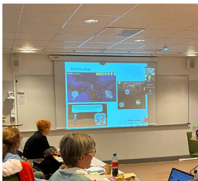
Vorstellung der Kidimo-App am EACH-Treffen in Lund, SE