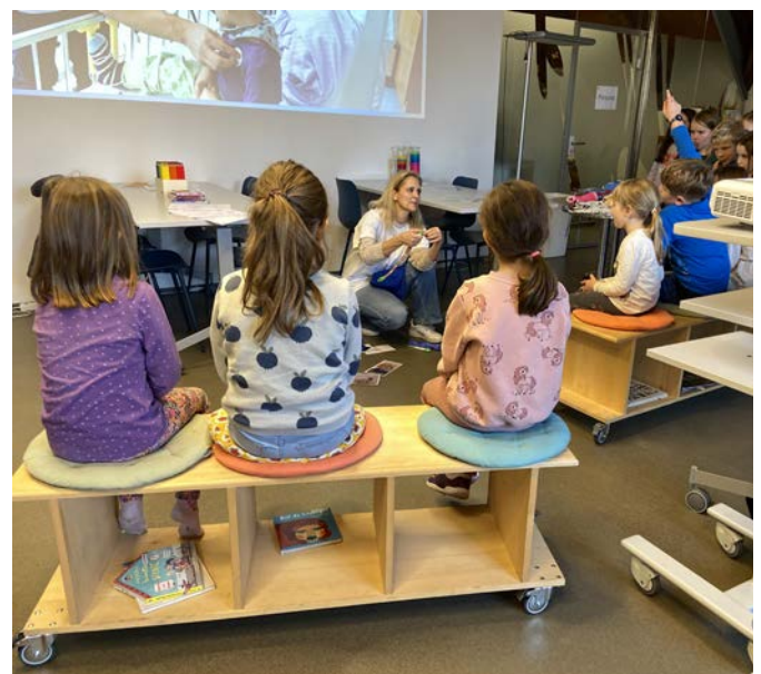
Workshop zu «Was passiert im Spital & Kinderrechte»

Anfang 2025 kündigte das Bundesamt für Gesundheit (BAG) an, die Finanzierung der Datenbank für Kinderarzneimittel (SwissPedDose) ab 2026 einzustellen. Diese Datenbank ist ein zentrales Instrument, um Ärzt:innen und Apotheker:innen evidenzbasierte Dosierungsempfehlungen für Medikamente bei Kindern zur Verfügung zu stellen – und damit eine sichere und bestmögliche medizinische Versorgung zu gewährleisten. Ohne sie drohen Behandlungsfehler,