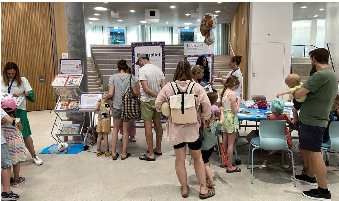
Am Kinderfest im neuen Kinderspital Zürich