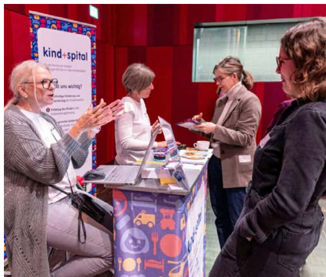
Vernetzung an der Fachtagung Kindsverlust